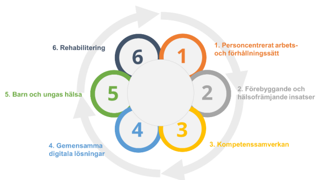
Figur 1: Områdena i Vårdsamverkans aktivitets- och tidplan.

Deluppföljning för vad som hänt i Vårdsamvekan Skåne under våren 2026. Många av aktiviteterna är processer som löper under längre tid så detta får ses som en ögonblicksbild över våren 2026. Aktiviteterna kopplar till de sex område som beskrivs i aktivitets- och tidplanen 1 .