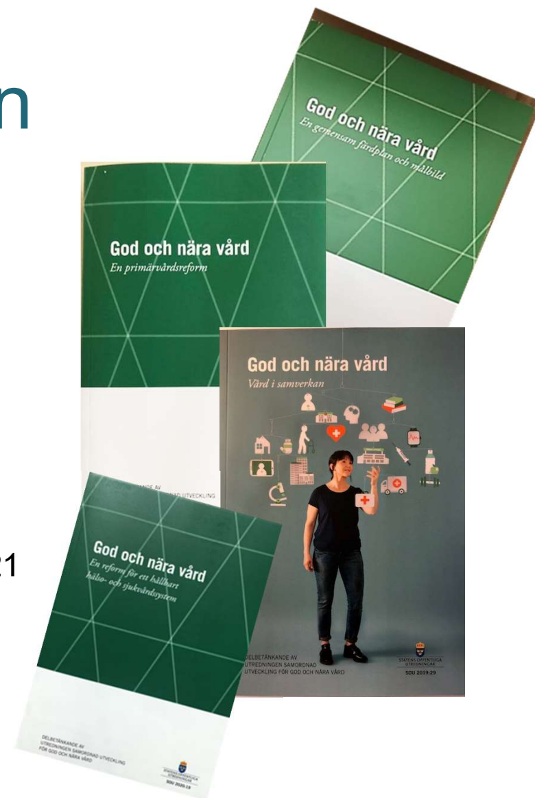
Samordnad utveckling för god och nära vård